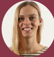
» Greta Reh Institut für Klimaschutz, Energie und Mobilität