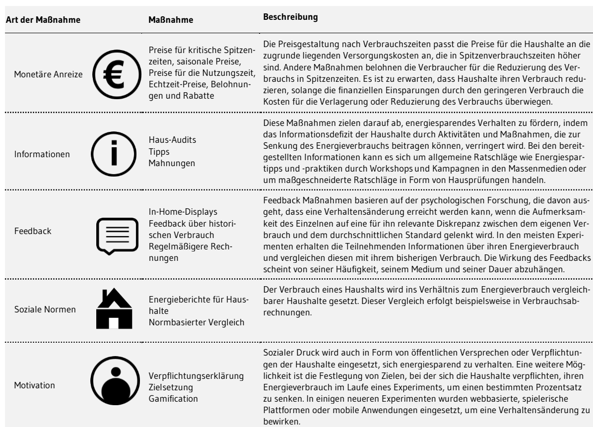
Abbildung 1: Typologie der nachfrageseitigen Eingriffe in den Energieverbrauch der Haushalte.

2018). In einigen neueren Experimenten wurden auch webbasierte, spielerische Plattformen („Gamification“) oder mobile Anwendungen zur Senkung des Energieverbrauchs eingesetzt. Spiele nutzen eine Kombination aus Informationsbereitstellung, Feedback und sozialem Druck, um eine Verhaltensänderung herbeizuführen. Obwohl es sich hierbei um einen relativ neuen Forschungsbereich handelt, gibt es erste Hinweise darauf, dass Gamification-Plattformen die Teilnehmenden zu kurzfristigen Energieeinsparung motivieren (Geelen et al. 2012), und dass einige der Verhaltensweisen auch auf lange Sicht bestehen bleiben (Allcott und Rogers 2014).