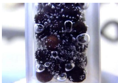
03: Wasserstoff löst sich vom Dehydrierkatalysator

Die Hydrierung einer ungesättigten organischen Verbindung ist eine exotherme Reaktion und wird unter erhöhtem Druck (30–50 bar) und bei ca. 150\text{--}200\text{ °C} in Gegenwart eines Katalysators durchgeführt. Wenn der an LOHC gebundene Wasserstoff wieder verfügbar gemacht werden soll, wird die nun hydrierte, wasserstoffreiche Form des LOHCs dehydriert, wobei der Wasserstoff wieder aus dem LOHC freigesetzt wird. Diese Reaktion ist endotherm und erfolgt bei 250\text{--}320\text{ °C} in Gegenwart eines Katalysators. Dafür wird ein Dehydrierkatalysator verwendet, der ebenfalls möglichst wenige Edelmetalle benötigen sollte, um kostengünstig zu sein.