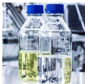
04: Mit Wasserstoff beladenes LOHC (links) bzw. unbeladenes LOHC (rechts)